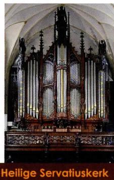
Stichting Smitsorgel Heilige Servatiuskerk

Secretariaat: Verhoevenlaan 46 5481 KH Schijndel Telefoon: 073-5430500 / 06-51800399 E-mail: info@smitsorgelschijndel.nl Bankrekening: NL45 RABO 0322 7696 55 Website: www.smitsorgelschijndel.nl