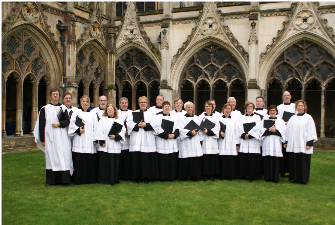
De Boxtelse Cantorij in "vol ornaat" in Canterbury.

Omdat het 400 jaar geleden is dat William Byrd overleed neemt zijn muziek tijdens het concert een centrale plaats in. Een uniek concert voor liefhebbers.